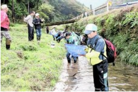
大野川の生き物を調べる小学生ら

ホタルの生息地として知られる岡山市北区御津虎倉の大野川で26日、生息する魚や昆虫を調べる「いきもの調査会」（市内外の教員らでつくる旭川源流大学実行委など主催）が開かれた。