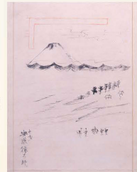
「三保松原図」 安藤徳太郎(歌川広重)／筆 1806年(文化3年)