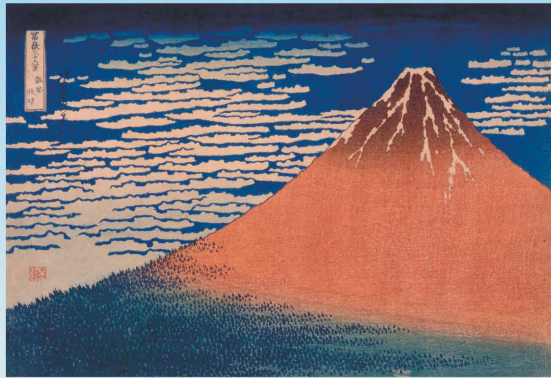
「富嶽三十六景 凱風快晴」葛飾北斎／画 1831～33年(天保2～4年)頃 【展示期間】6月7日～30日