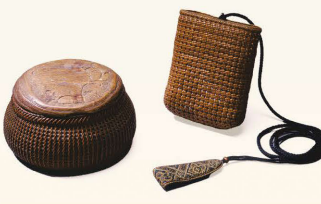
歌川広重遺品 煙草入れと伏落とし