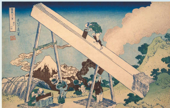
「富嶽三十六景 遠江山中」葛飾北斎／画 1831～33年(天保2～4年)頃