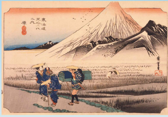
「東海道五拾三次之内 原朝之富士」歌川広重／画 1834～36年(天保5～7年)頃