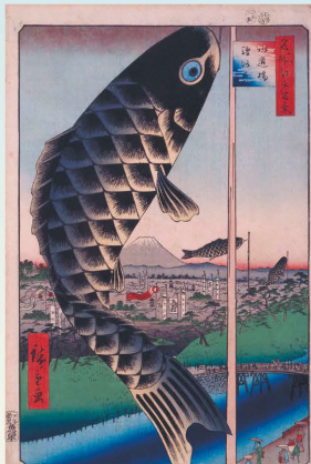
「名所江戸百景 水道橋駿河台」 歌川広重／画 1857年(安政4年)