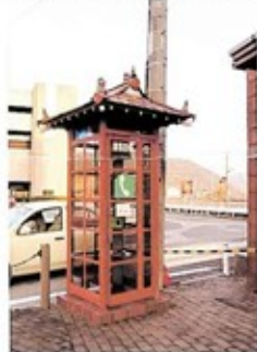
備前陶芸美術館の外にある「屋根が備前焼の公衆電話」

「でも備前焼って身の回りでもそんなに見かけないな」という人も少なくない。これは私達に見えないうちで活躍しているのだ。例えば、岡山市役所・岡山駅・岡山空港、更には東京駅にある「首相官邸」にも、壁にタイルとして使われている。今度テレビで確認してみれば、首相が取材を受けている際の後ろ側の壁で、備前焼は陰に建物を支えてくれているはずだ。