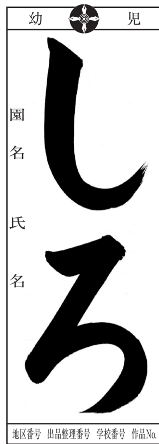
(楷書) 幼児の学校番号は0番