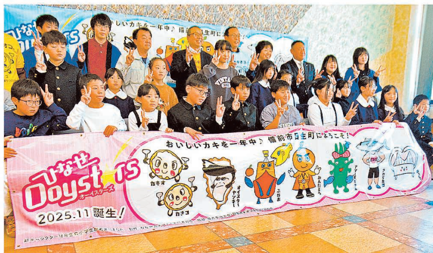
「ひなせオイスターズ」の8体がデザインされた横断幕と入賞した児童ら

6体は、殻付きカキがサングラスをかけて髪形はリーゼントで決めた「オイスターヤンキー」、頭はサワ「備前♡日生大橋」が両手